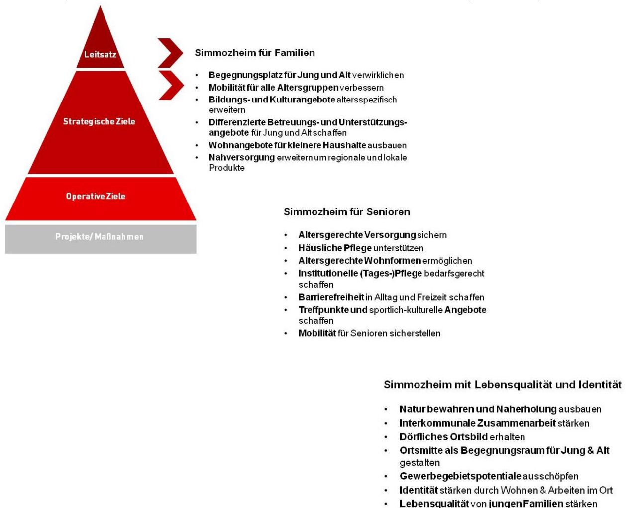
Abb.: Strategische Ziele aus der Gemeinderatsklausur für die Diskussion mit den Beteiligten