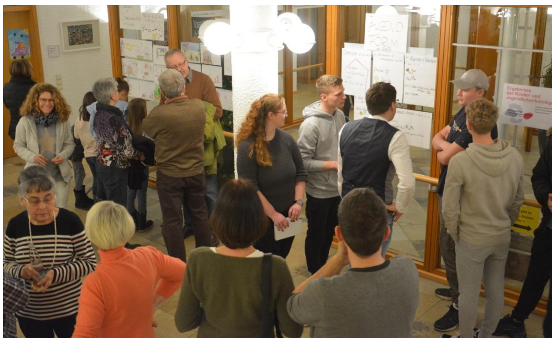
Fotos: Ergebnisse der Kinder- und Jugendlichenbeteiligung (eigene Aufnahmen, planbar 3 )