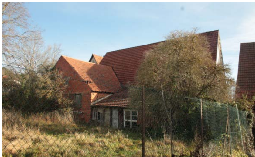
Schillerstraße 8/1 (Rückseite): Schlechter Pflegezustand von Gebäude und Freibereich