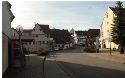
Hauptstraße Kreuzung Blücherstraße: fehlende Aufenthaltsqualität, reiner Verkehrsraum