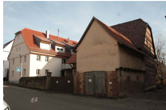
Bohnenbergerstraße 2: Substanzielle Mängel an der Bausubstanz der Nebengebäude