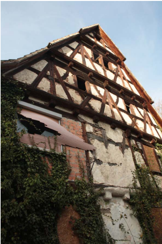
Schillerstraße 10: Substanzielle Mängel an der Bausubstanz