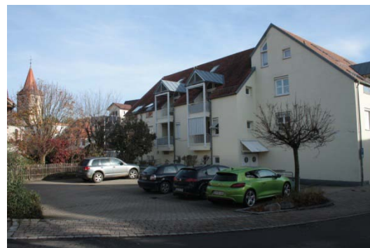
Goethestraße: mangelnde Attraktivität privater Freiflächen, hoher Versiegelungsgrad