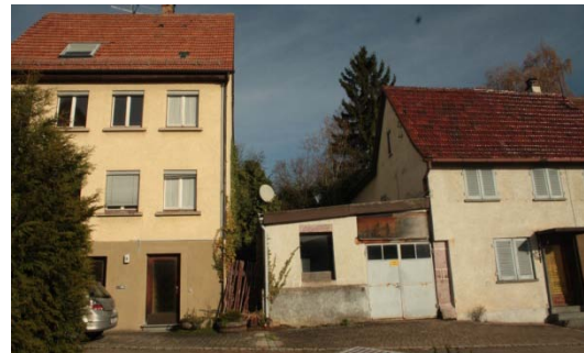
Schillerstraße 6 - 8: Leerstände, erhebliche Mängel in der Bausubstanz