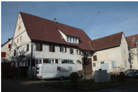
Hauptstraße 24: Erhebliche Mängel an der Bausubstanz

Im zentralen Baufeld sind die Gebäude überwiegend jüngeren Baudatums und deshalb noch in besserem Zustand. Dazu zählen das Rathaus, das Wohn- und Geschäftshaus mit dem Lebensmittelmarkt sowie fünf weitere Wohn- und Nebengebäude. Insgesamt sind damit nur 16% der Gebäude im Untersuchungsgebiet in gutem baulichem Zustand und entsprechen den zeitgerechten Nutzungsanforderungen.