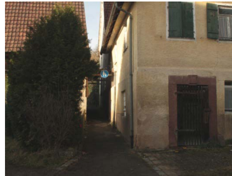
„Winkel“ zw. Schillerstraße 14/2, 12: wichtige, aber auffällige Wegeverbindung