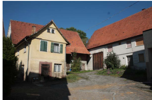
Schillerstraße 10, 8/1, 12: verwahrloste Freiflächen beeinträchtigen das Ortsbild