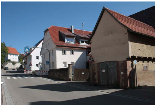
Bohnenbergerstraße 2: Differenter Modernisierungszustand, heterogenes Ortsbild