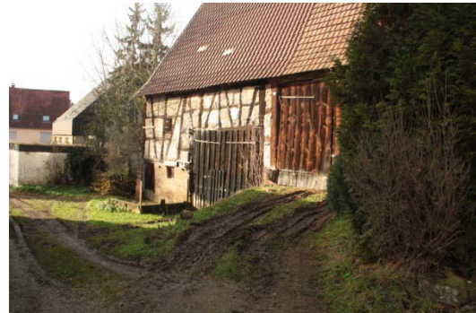
Schillerstraße 14/2: Teilleerstand, Substanzelle Mängel am Kulturdenkmal