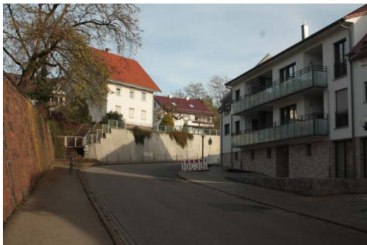
Hauptstraße: Enger Fußweg auf der Westseite, reiner Verkehrsraum

Funktionale Konflikte sind zudem in weiteren fünf Bereichen anzutreffen, in denen die Grundstücksverhältnisse historisch bedingt eine zeitgemäße Wohnqualität und Erschließung beeinträchtigen. Teilweise verwinkelte und kleine Grundstückszuschnitte, eine hoher Überbauungsanteil, Grenzbebauungen und damit erschwerte Belichtungsmöglichkeiten sind an folgenden Gebäudekomplexen anzutreffen: Schillerstraße 27, Hauptstraße 14 und 14/1, Hauptstraße 17 sowie überwiegend im Schillerareal (Schillerstraße 14/2, 14/3, 4, 6, 8, 8/1, 12). Die Funktion und Nutzung der Grundstücke der Schillerstraße 13/1, 14/2, 19 und 20 sind zusätzlich durch eine erschwerte Erschließung eingeschränkt.