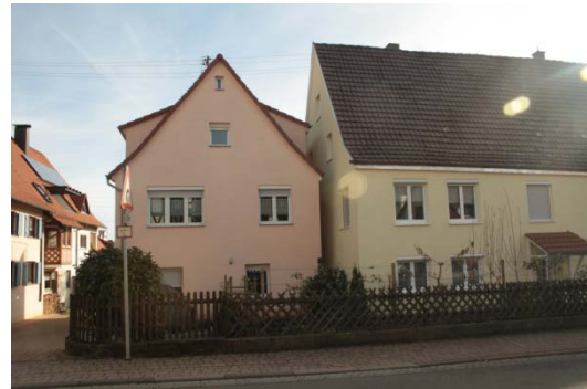
Hauptstraße 17 und 15: schwierige Grundstücksverhältnisse