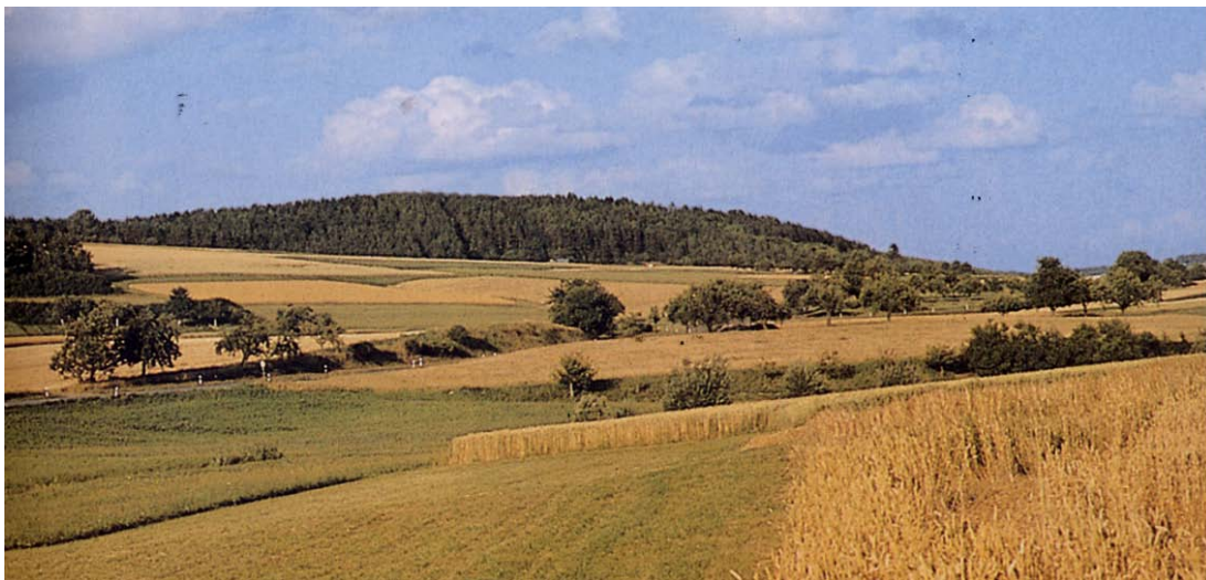
Foto: Landschaft um den Ort Simmozheim