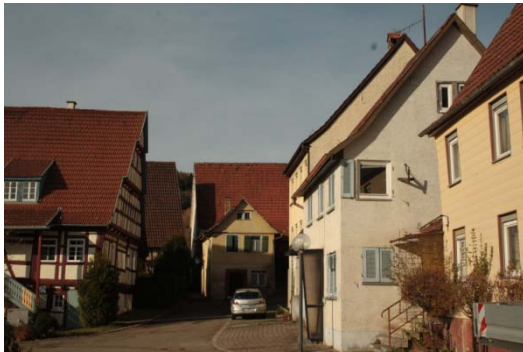
Schillerareal: Leerstände beeinträchtigen das Umfeld