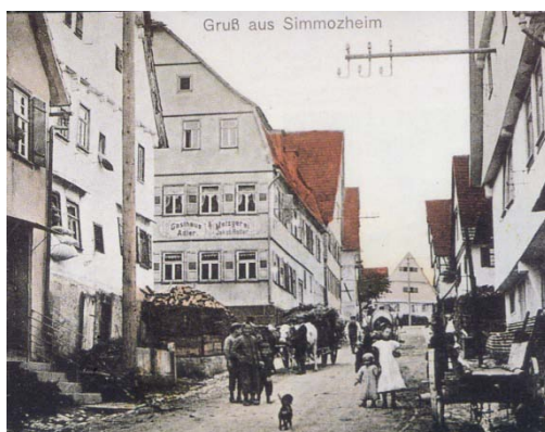
Postkarte vor 1926: Hauptstraße

Bis ins 19. Jahrhundert war der Ort geprägt durch das Leben der Kleinbauern, Handwerker und Tagelöhner. Der Schwarzenbach floss damals noch oberirdisch durch die Ortsmitte und ermöglichte an vielen Stellen Brunnen, von denen heute einige erhalten geblieben sind (z.B. in der Schillerstraße). Entlang der Hauptstraße prägten im 18. und 19. Jahrhundert viele Gasthäuser das Ortsbild. Im Untersuchungsgebiet besteht das ehemalige Gasthaus Sonne (Hauptstraße 14) noch als Pension und Bäckerei und Café. Das Gebäude ist als Kulturdenkmal derzeit in Prüfung. Weitere fünf Kulturdenkmale nach §2 des Denkmalschutzgesetzes liegen in der Ortsmitte, darunter das Backhaus (Schillerstraße 23) sowie ein Gehöft (Hauptstraße 2), ein Fachwerkwohnhaus (Schillerstraße 14) und eine Scheune (Schillerstraße 14/2). Vier Scheunen und Wohnhäuser (Schillerstraße 8/1, 10, 12 und Hauptstraße 24) sind zudem ortsbildprägende Baukörper mit einem hohen Gestaltwert. Sie spiegeln die historische Bedeutung der Siedlung wieder und sind deshalb identitätsstiftend. Der abgegrenzte Siedlungsbereich hat vor allem durch den Strukturwandel in der Landwirtschaft seine ursprüngliche Bedeutung weitestgehend verloren, ist heute jedoch für die alltägliche Versorgung der Einwohnerinnen und Einwohner wichtig. Das Versorgungszentrum umfasst das Rathaus sowie zahlreiche Einzelhändler und Dienstleister. 3, 4