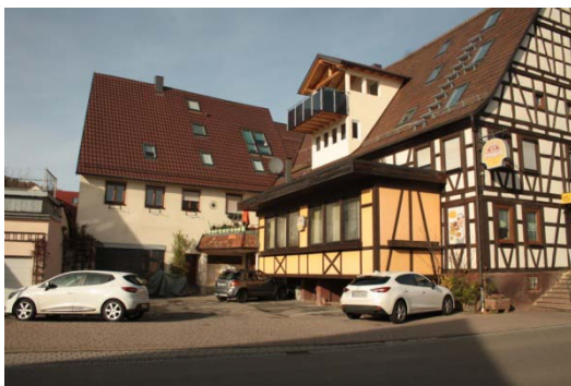
Hauptstraße 14, 14/1: mangelnde Attraktivität privater Freiflächen, hoher Versiegelungsgrad