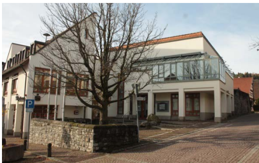
Rathaus: nicht zeitgemäße Gestaltung öffentlicher Freiflächen, wenig attraktiv zum verweilen