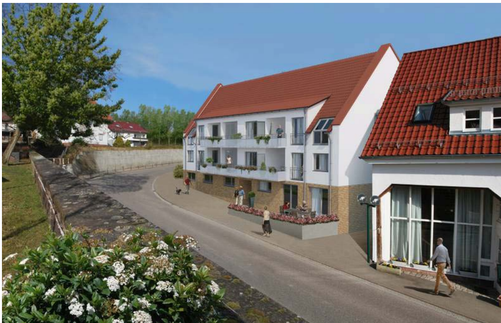
Betreutes Wohnen in der Ortsmitte

Vor dem Hintergrund einer älter werdenden Gesellschaft sowie kleiner werdenden Haushalten wurde aktuell direkt an das Untersuchungsgebiet angrenzend ein Wohnkonzept speziell für Betreutes Wohnen älterer Menschen realisiert (s. Abbildung).