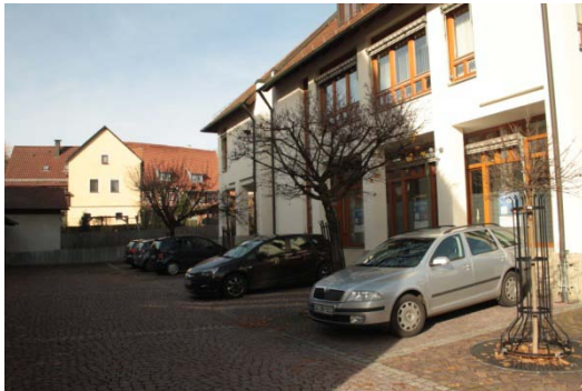
Hauptstraße 8, Rathaus: begrenzte öffentliche Stellplätze