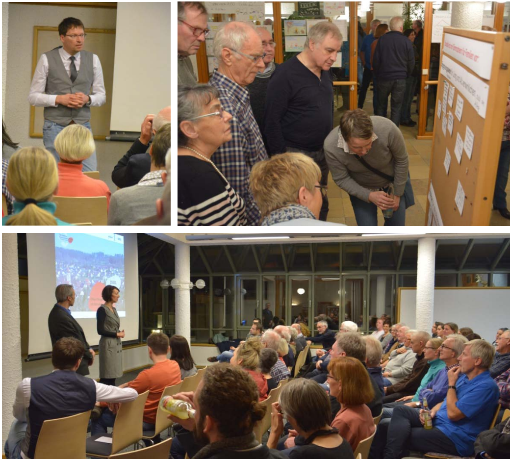
Fotos: Offene Bürgerwerkstatt am 19. Januar 2018