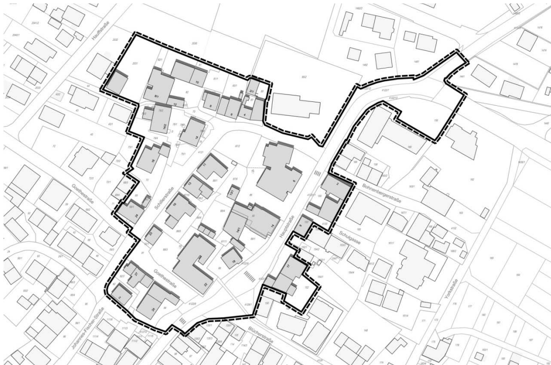
Plan: Abgrenzung des Untersuchungsgebietes „Ortskern/ Schillerareal“, ca.1,9 ha (eigene Darstellung: planbar 3 ; Plangrundlage: Gemeinde Simmozheim)

Im Bericht wurden die sozialen, strukturellen und vorrangig städtebaulichen Gegebenheiten und Zusammenhänge im Ortskern von Simmozheim untersucht. Nach einer Bestandsaufnahme und der Ortsanalyse (s. Kapitel 2) wurden die räumlich- strukturelle Gliederung sowie die Funktionsfähigkeit des Gebietes analysiert. Auf dieser Basis wurden die Missstände, Defizite und Konflikte des Ortskerns erfasst und im Plan dargestellt. Stärken und Potenziale des Untersuchungsgebietes wurden dem gegenüber gestellt (s. Kapitel 3).