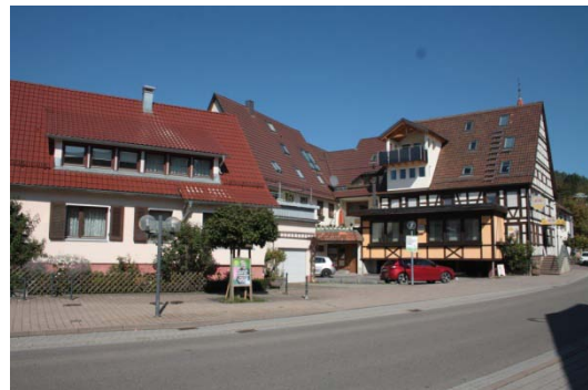
Hauptstraße 14, 14/2, 18: Kleinteilige, moderne Anbauten an Fachwerkgebäude, heterogenes Ortsbild