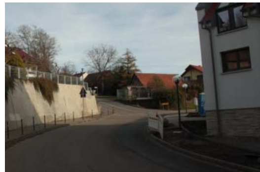
Merklinger Straße Einmündung Hauptstraße: fehlende Straßenquerungsmöglichkeit