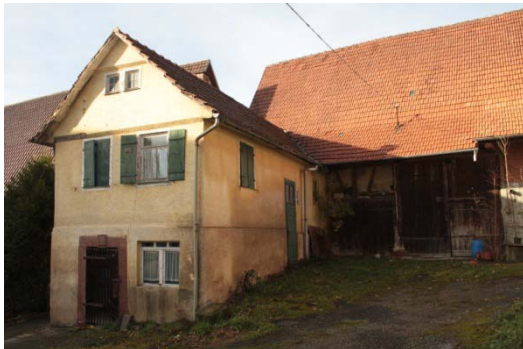
Schillerstraße 12: Leerstand und Verfall der Substanz

Das Fehlen einer klar ausgeformten und gestalteten Ortsmitte als sozialer Treffpunkt im gesamten Ortskern ist der schwerwiegendste strukturelle Missstand. Eine größere Platzfläche im Zentrum für Veranstaltungen und Feste ist nicht vorhanden. Die Begegnung von unterschiedlichen Gesellschafts- und Altersgruppen wird derzeit durch die städtebauliche Struktur im Ortskern nicht ermöglicht, was für den Wohnstandort Simmozheim und besonders den historischen Ortskern ein großes Defizit darstellt.