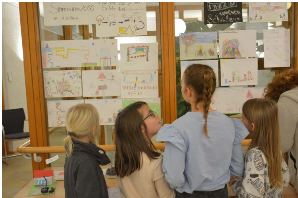
Foto: Ausstellung der Ergebnisse der Kinder- und Jugendlichenbeteiligung im Rathaus zur Offenen Bürgerwerkstatt