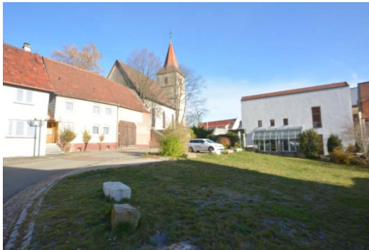
Schillerstraße (ehemals 7): Brache, Lücke im Ortsgrundriss