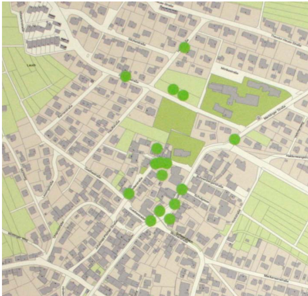
Foto: Verortung von Missständen im Ortskern durch Bürgerinnen und Bürger bei Bürgerversammlung